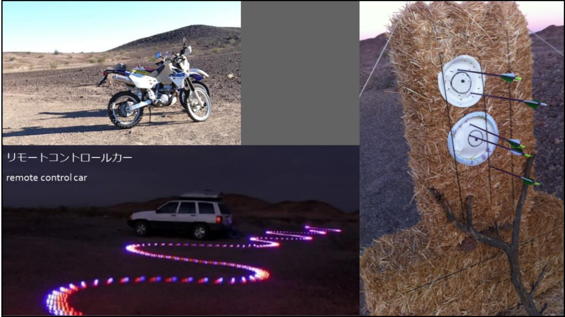
リモートコントロールカー remote control car